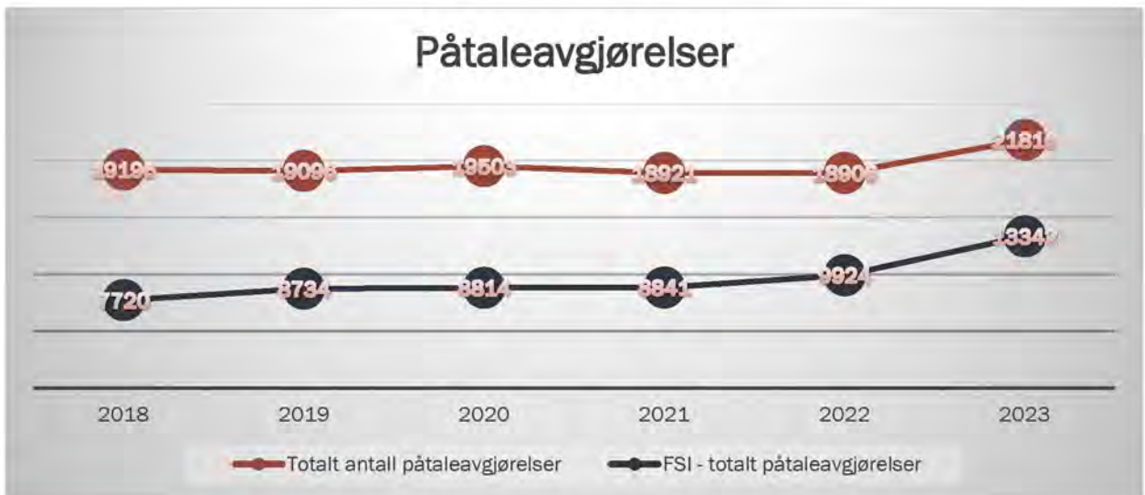
Figur 1 - Påtaleavgjørelser APD og FSI

Antallet negative påtaleavgjørelser har i samme tidsrom økt, og det samme har FSIs andel av de negative påtaleavgjørelsene fra rundt 6 500 av totalt ca. 11 000 (59 %) i 2019-2021 til over 11 000 av ca. 14 800 (74 %) i 2023.