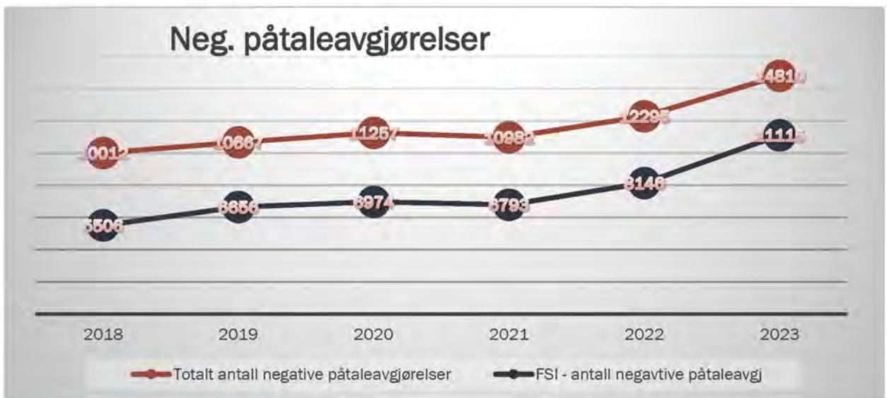
Figur 2 - Negative påtaleavgjørelser APD og FSI

Antallet negative påtaleavgjørelser har i samme tidsrom økt, og det samme har FSIs andel av de negative påtaleavgjørelsene fra rundt 6 500 av totalt ca. 11 000 (59 %) i 2019-2021 til over 11 000 av ca. 14 800 (74 %) i 2023.